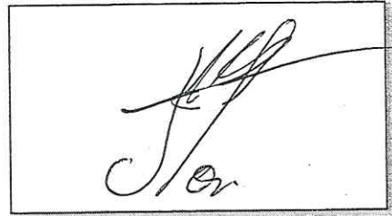
NOMBRE Y FIRMA DEL SOLICITANTE