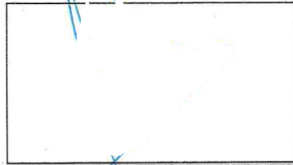
NOMBRE Y FIRMA DEL SOLICITANTE