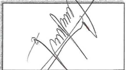
NOMBRE Y FIRMA DEL SOLICITANTE