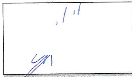
NOMBRE Y FIRMA DEL SOLICITANTE