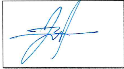
NOMBRE Y FIRMA DEL SOLICITANTE