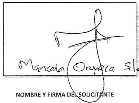
NOMBRE Y FIRMA DEL SOLICITANTE