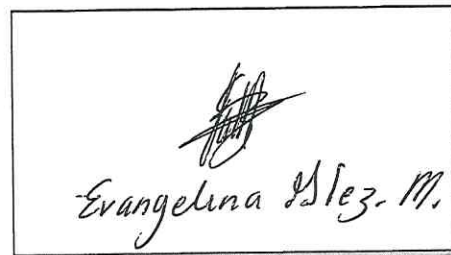
NOMBRE Y FIRMA DEL SOLICITANTE