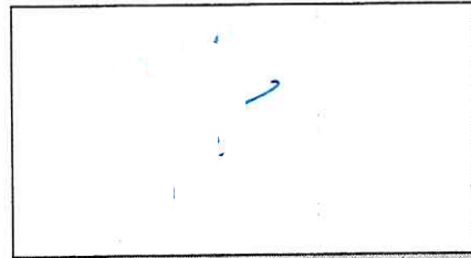
NOMBRE Y FIRMA DEL SOLICITANTE