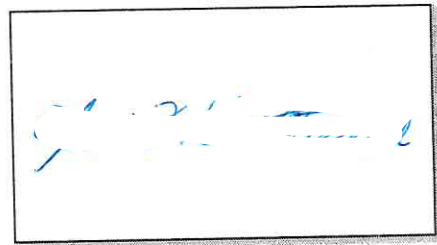
NOMBRE Y FIRMA DEL SOLICITANTE