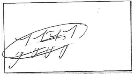
NOMBRE Y FIRMA DEL SOLICITANTE