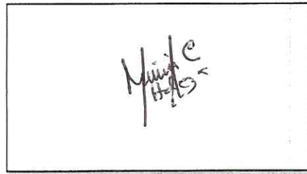
NOMBRE Y FIRMA DEL SOLICITANTE