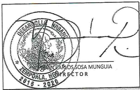
AUTORIZACION DESARROLLO URBANO

* LA EXPEDICION DE LA PRESENTE LICENCIA POR PARTE DEL MUNICIPIO, AMPARA UNICAMENTE EL TRAMITE DE SOLICITUD DE CONSTRUCCION Y NO EXIME AL SOLICITANTE DE LOS PERMISOS Y PROCESOS, QUE PARA SU FUNCIONAMIENTO REQUIERE LA OBRA POR PARTE DE LAS DEPENDENCIAS ESTATALES Y FEDERALES, ASI MISMO EL MUNICIPIO NO SE HACE RESPONSABLE POR VIOLACIONES DE MAL FUNCIONAMIENTO EMITIDAS POR ESTAS.