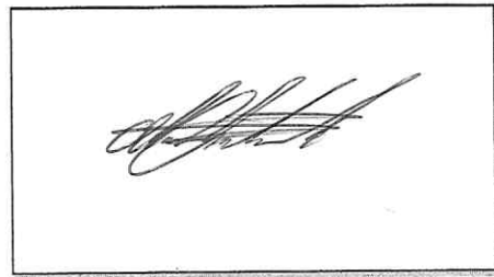
NOMBRE Y FIRMA DEL SOLICITANTE